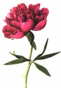
PIVOŇKA - LÉKARSKÁ

Pivoňky jsou vytrvalé bylinky, keře či polokeře. Korunní květy bývají velké a barevně výrazné. Pivoňka by se v léčitelstvích měla používat pouze pod dohledem zkušeného odborníka. Měla by léčit šílenství, křeče a epilepsii. Největší sbírka pivoňek je v Botanické zahradě hlavního města Prahy.